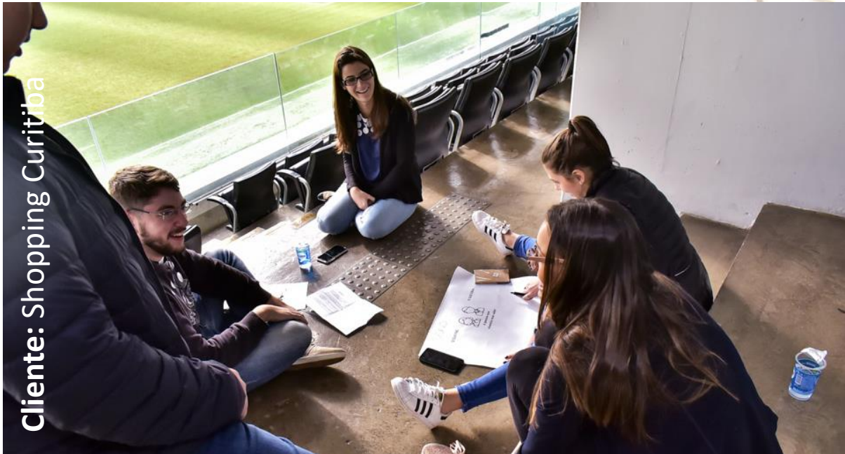
Cliente: Shopping Curitiba