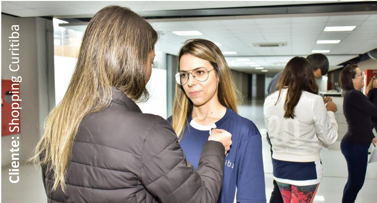
Cliente: Shopping Curitiba