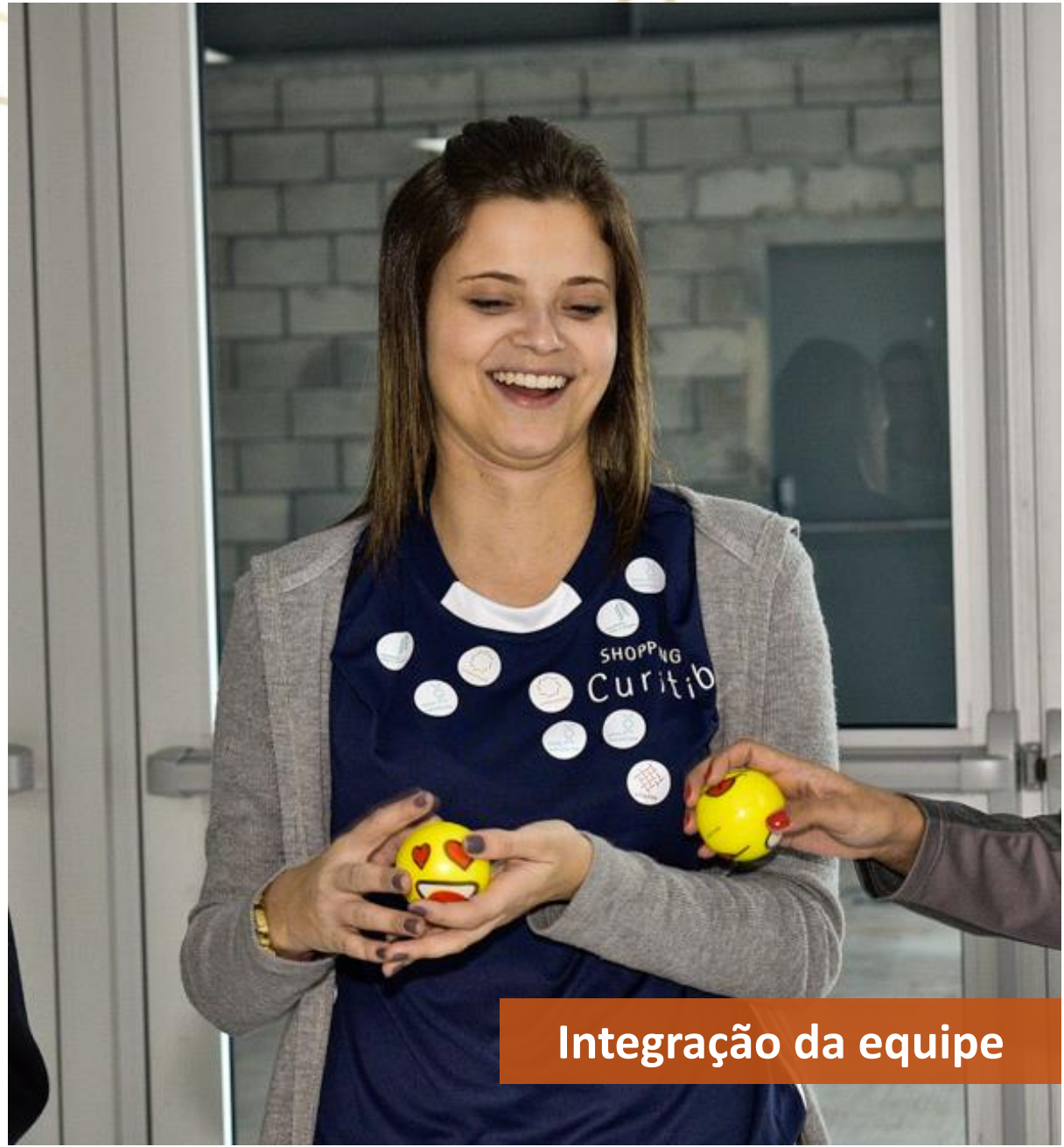
Integração da equipe